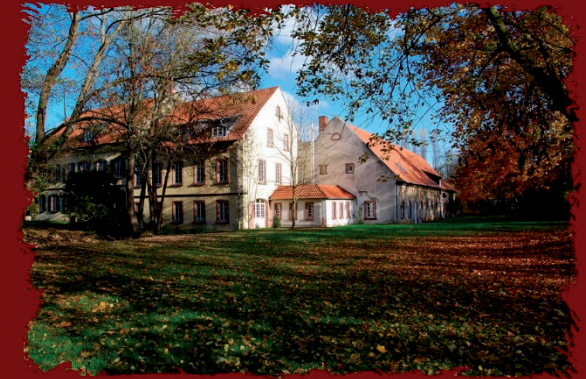
Monsheim /Südlicher Wonnegau

VERBANDSGEMEINDE MONSHEIM DER SÜDEN RHEINHESSENS